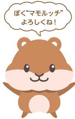
「新コープのケガ保険」 マスコットキャラクター マモルッチ