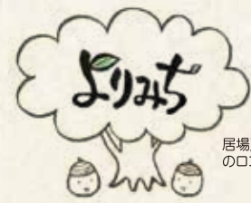
居場所「よりみち」のロゴ