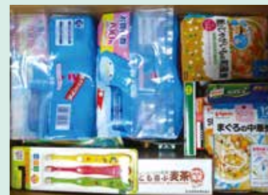
◀ 子育て中の退所者向けには、子ども用品を中心に箱詰めしています

児童養護施設の子どもたちは一定の年齢になると退所し、自活することになります。しかし、心身共に十分な準備が整わず社会に出て、金銭的にも厳しい状況に置かれる子どもも多く、アフターケアが必要です。昨年は退所者からコロナ禍で仕事を失った、職場環境が悪化して体調不良となった、孤立感に苛まれているなどの、SOSが届きました。施設の物品を分けるだけでは到底足りません。助成金で、お米券やレトルト食品、乾麺、調味料等の食品、トイレトペーパーや洗剤等の日用品、マスクや消毒液等の新型コロナウイルス対策衛生用品を購入して、遠方で生活する者や学生に送りました。また、子育て中の退所者には、ミルクや子育て用品も購入し、配布します。物の支援と同時に、関係性を保ち今後の活動に生かしていきます。