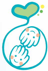
生活クラブ福祉事業基金

生活クラブ共済事業連合生活協同組合連合会 〒160-0022 東京都新宿区新宿6-24-20 TEL03-5285-1865