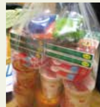
◀ 地域連携拠点で食品などを配布します